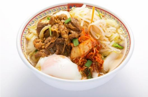
■秋のピリ辛 牛カルビラーメン 862円（税抜）/930円（税込）