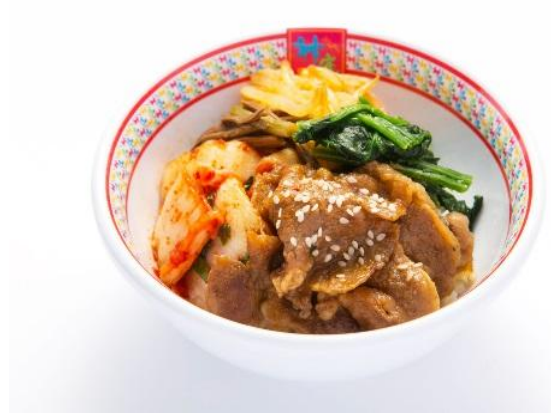
■牛カルビ ビビンバ 単品：463円（税抜）/500円（税込） セット：399円（税抜）/430円（税込）

※香芝店・香芝SA店・長吉店・河内長野店・鶴見店・平野店・イオン洛南店・イオンモール名古屋茶屋店ではお取扱いがございません。 ※神座飲茶樓 グランルーフ店・横浜ジョイナス店ではお取扱いがございません