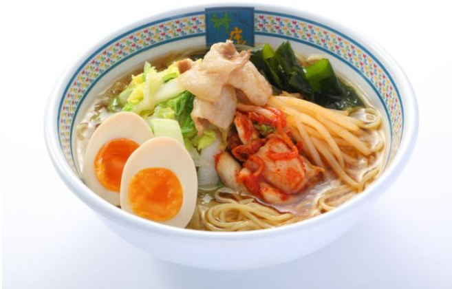
■冷たいおいしいラーメン