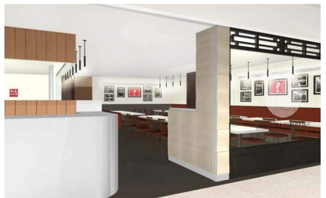
<『神座飲茶樓 横浜ジョイナス店』外観・内観イメージ>