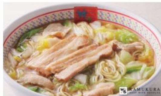
【神座看板メニュー: おいしいラーメン】 ※価格は店舗によって異なります。