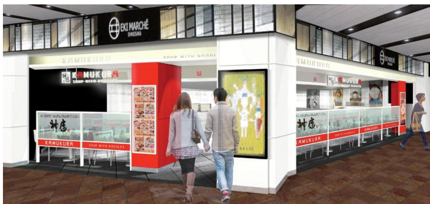
『どうとんぼり神座 エキマルシェ新大阪店』外観イメージ

新大阪駅をご利用の際は、満を持しての出店となる『どうとんぼり神座 エキマルシェ新大阪店』に、ぜひお気軽にお立ち寄りください。