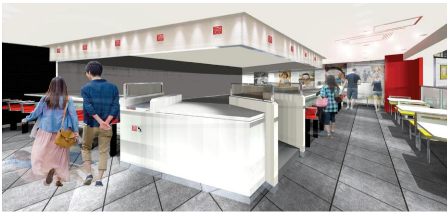
『どうとんぼり神座 エキマルシェ新大阪』内観イメージ