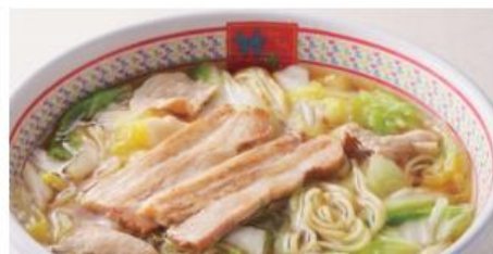
【神座看板メニュー：おいしいラーメン】 ※価格は店舗によって異なります。

この「おいしいラーメン」の人気により、大阪・道頓堀に4坪9席からスタートした店は、1日500杯以上を売り上げる人気店になりました。現在は、東京・関西を中心に36店舗を展開しています。