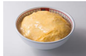
東京ドームの屋根を彷彿とさせるインパクト抜群のドームラーメン

玉子とあんかけを乗せて器に蓋をし、まるで東京ドームの屋根を彷彿させるインパクト抜群のビジュアルが目を引く当店のみの限定メニュー。玉子をあけると中は栄養満点のたっぷり野菜とコラーゲンたっぷりの炙りチャーシューが3枚も盛り付けられており、見た目にも味にも大満足の一品。※1日30食限定