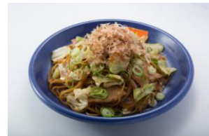
秘伝のラーメンスープをベースにつくり上げた神座風焼きそば

『神座風焼きそば』は神座初のテイクアウト専用オリジナルメニュー。「3回食べたならもうやめられない、くせになる。」がコンセプトである神座秘伝のラーメンスープをベースにつくり上げた他に類を見ない逸品。東京ドームへスポーツやライブ観戦に行く際など、気軽にお召し上がりください。