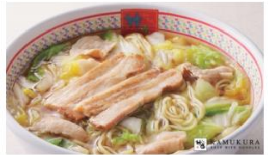
【看板メニュー/おいしいラーメン 530円】 ※価格は販売エリアにて異なります