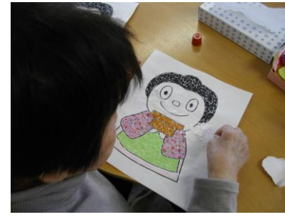
ひとちぎりずつとって